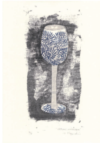
DM イメージ作品 “Octopus arabesque” 297×210mm 謄写版・和紙 2017