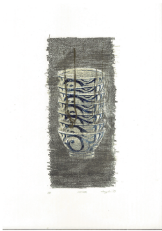
“noise” 364×257mm 謄写版・和紙 2017